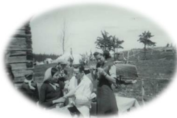
COLLECTIONS MUSÉE ARMAND-FRAPPIER